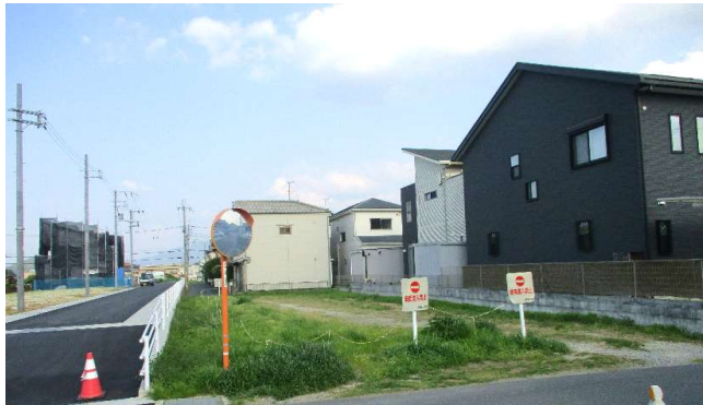
敷地西側から撮影