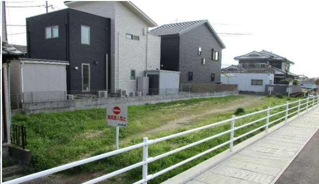
敷地北東から撮影